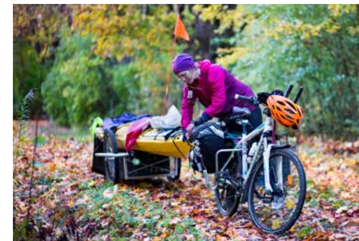
Särskilt bråttom har hon inte. Vägen är målet, och allt det där.